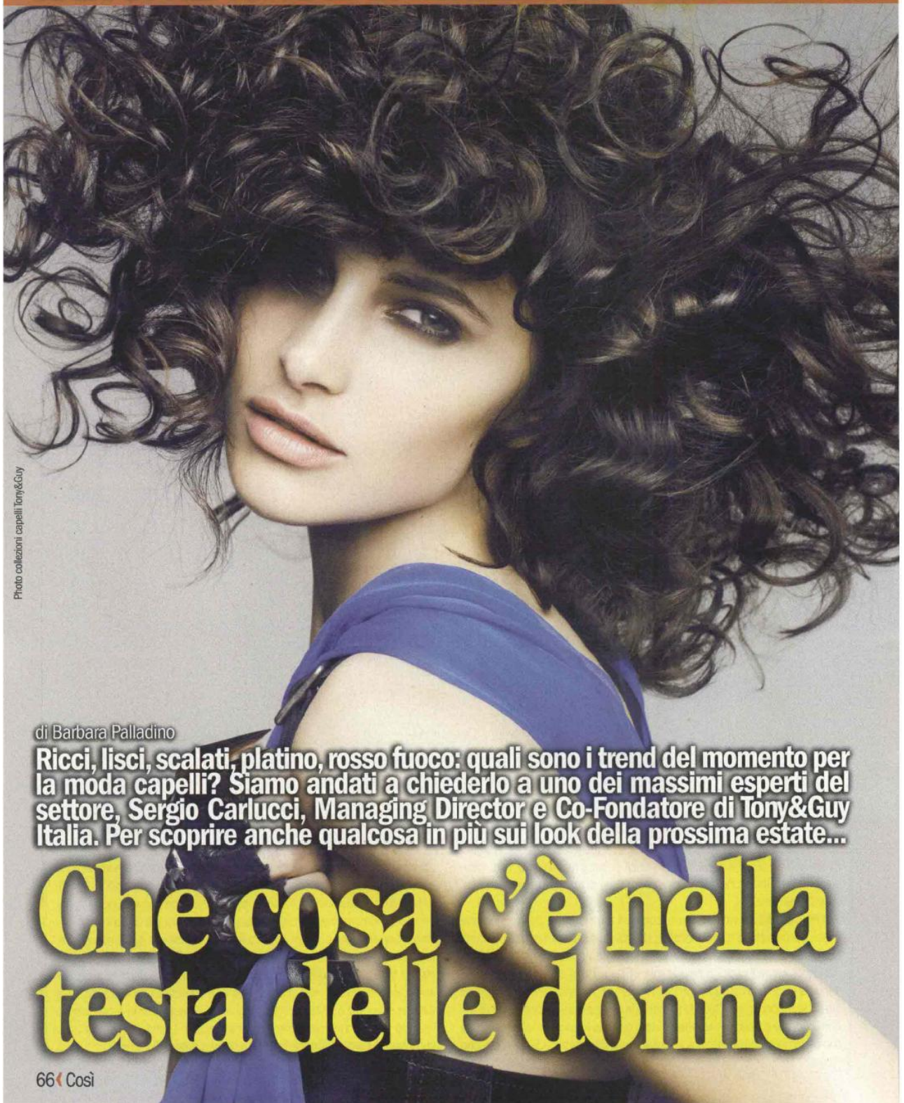
Photo collezioni capelli Tony&Guy

HAIR STYLE TUTTE LE LUNGHEZZE SONO AMMESSE MA