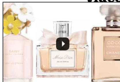
Daisy by Marc Jacobs