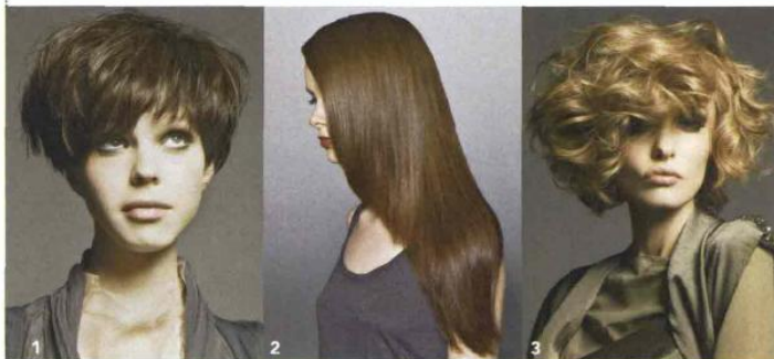
1. Equilibrio di volume e proporzioni per il corto Evos, adatto ai volti più minuti. 2. La scalatura morbida e ovale di Jean Louis David sottolinea il viso. 3. Onde sexy e toni soft, è il medio Evos.