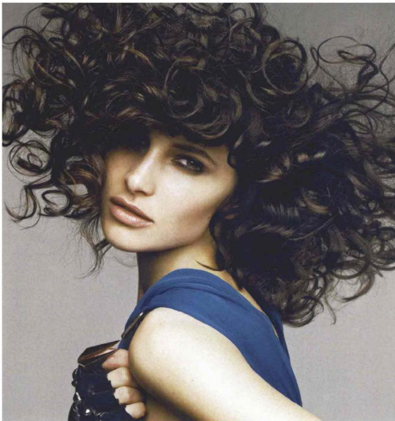
Ritorna prepotentemente il mosso, e il movimento naturale delle ciocche, nella collezione primaverile di Tony&Guy. Sulla media lunghezza i ricci morbidi e ariosi addolciscono i tratti.