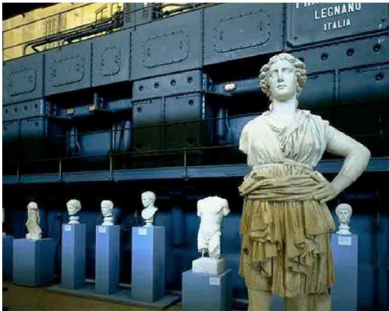
Gli abiti dei sette stilisti italiani e internazionali, sfileranno nel suggestivo contrasto creato tra i vecchi macchinari produttivi della centrale e capolavori della scultura antica.