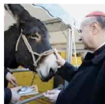
Festa S. Antonio Abate: benedizione animali a San Pietro, le foto