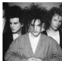
I Cure in concerto a Rock in Roma il 9 luglio 2012