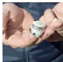
Sabbia dai rubinetti: arrivata anche a Roma Est, segnalazioni in aumento