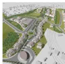
Monte Stallonara, "i pionieri della nuova Roma" tra fango e polvere nel quartiere fantasma