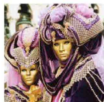
Carnevale 2012: tutti gli eventi di Roma e Provincia