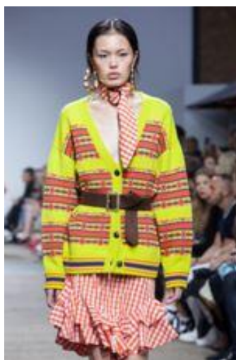
House of Holland

La semplice e raffinata coda di cavallo regna sovrana nella stagione Primavera/Estate 2017, dove House of MEA e House of Holland hanno dato il proprio tocco personale a questo look classico. House of MEA ha scelto di presentare code di cavallo basse tradizionali, pettinate all'indietro e rifinite con label.m Shine Mist. Anche i gipsy di House of Holland presentavano capelli raccolti in code di cavallo basse, che però sono state cotonate e raccolte in spiritose trecce e infine rifinite con label.m Hairspray per mantenere la piega.