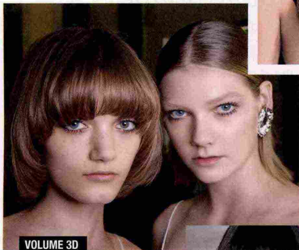
VOLUME 3D E LUNGHE LINEE RETTE