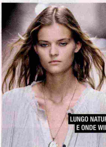
LUNGO NATURALE E ONDE WILD

Nuance di punta: cioccolato dark e biondo appena sfumato. E, per ragazze coraggiose, anche argento e salmone