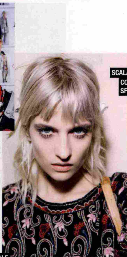
SCALATO '70 CON CIOCCHE SFILZATE