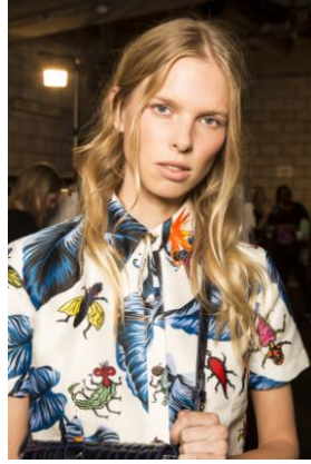
House of Holland