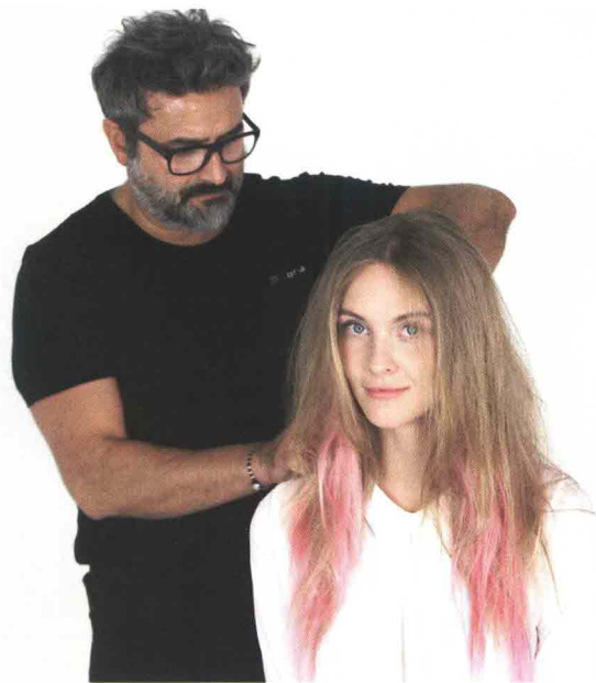
Hair stylist: Giovanni Lunardon Inebrya Ambassador Make-up: Francesca Sattin

IL GIUDIZIO DI GIOVANNI LUNARDON - INEBRYA INTERNATIONAL AMBASSADOR, TITOLARE DEL SALONE