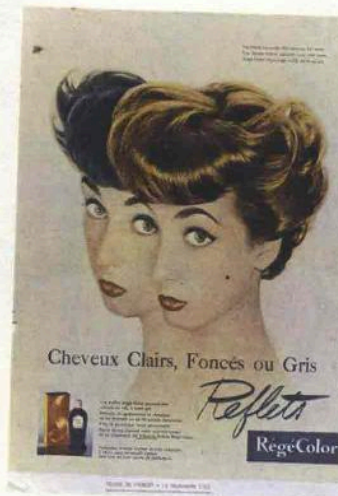
HERITAGE IMAGES/MICHAEL WALTER, HONEY SALVADORI, KIRSTIN SINCLAIR, RICHARD MILES, RAMSHERGILL