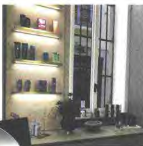
Semplicità ed eleganza caratterizzano il nuovo salone Toni&Guy a Brera.