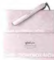
ghd ricorda alle donne di tutto il mondo di donare un po' di tempo al loro seno davanti allo specchio e di autocontrollarsi ogni mese.

ghd sostiene la Fondazione Umberto Veronesi con la Collezione Take Control Now. Per celebrare 16 anni di sostegno a enti benefici che combattono il cancro al seno a livello globale, ghd ha collaborato con 11 donne a cui è stato diagnosticato un cancro al seno prima dei 35 anni.