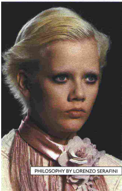
PHILOSOPHY BY LORENZO SERAFINI