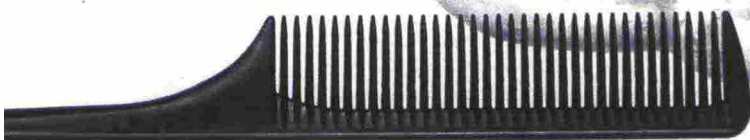
Di bioplastica riciclabile, il pettine di Franck Provost (3,90 euro) è ideale per tenere in ordine le ciocche corte.

Il ferro Little Styler di Jean Louis David (24,99 euro), formato travel, si usa per lisciare e per dare volume.